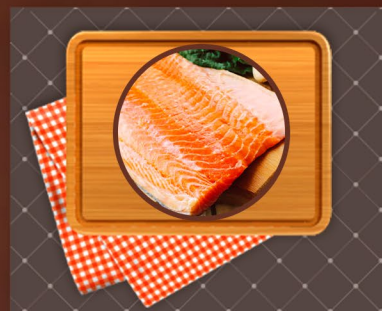
Salmón Filet Desespinado