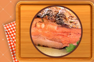
Llama Lomo, Cuarto deshuesado, y Costillar