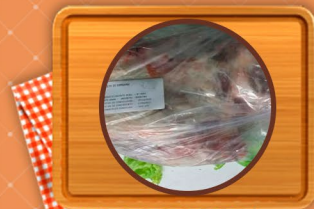
Paleta con y sin hueso