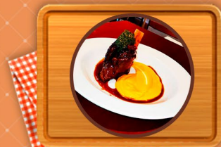
Garrón de cordero