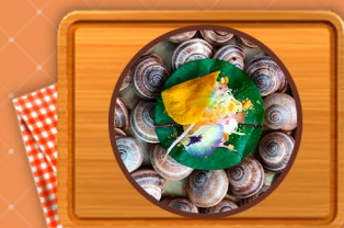
Caracoles y Caviar Blanco de Caracol