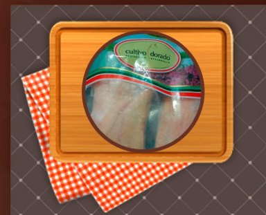
Surubí Filet de Lomo Desespinado