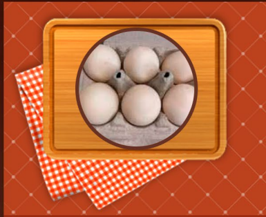
Huevos de pato