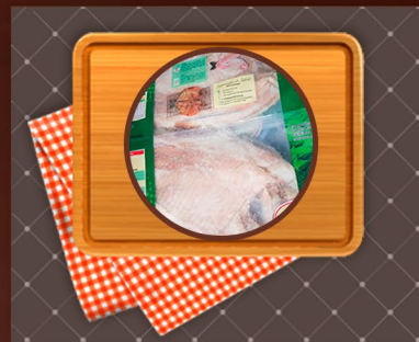
Pacú Desespinado Mariposa y Filet