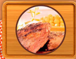
Jabalí Lomo, Bondiola, Cuarto deshuesado, y Costillar