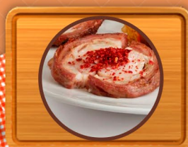
Chinchulines, mollejas y otros