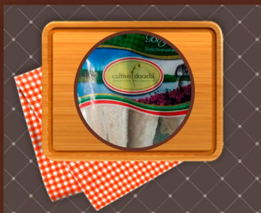
Boga Filet Desespinado