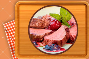
Ciervo Lomo, Cuarto deshuesado, y Costillar