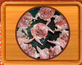
Codomiz Entera y Deshuesada