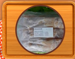
Ranas y Ancas