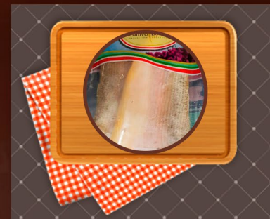
Dorado Filet Desespinado