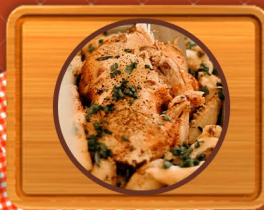
Pavita, Pechuga de Pavita