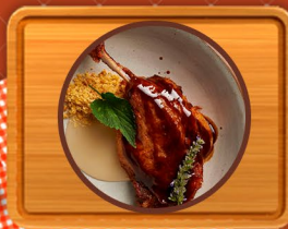
Pato Entero, Pata Muslo, Magret, Foie, Hígado, Grasa, etc.