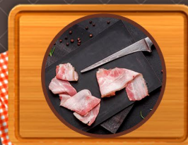
Tocino y otros