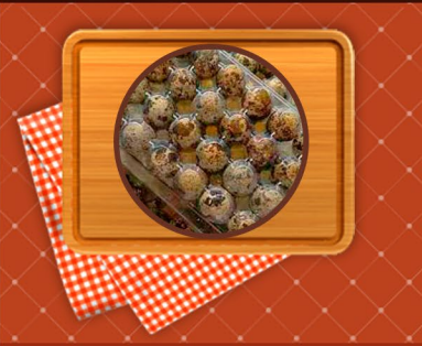
Huevos de codorniz