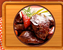
Hígado de Pollo